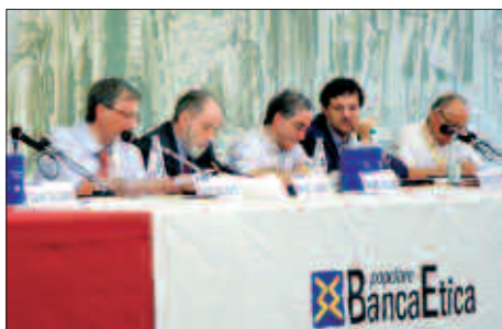
Assemblea dei soci del 26 maggio 2007, Padova.