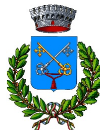
COMUNE DI VAGLIA