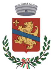
COMUNE DI CALENZANO