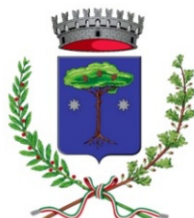
COMUNE DI VICCHIO