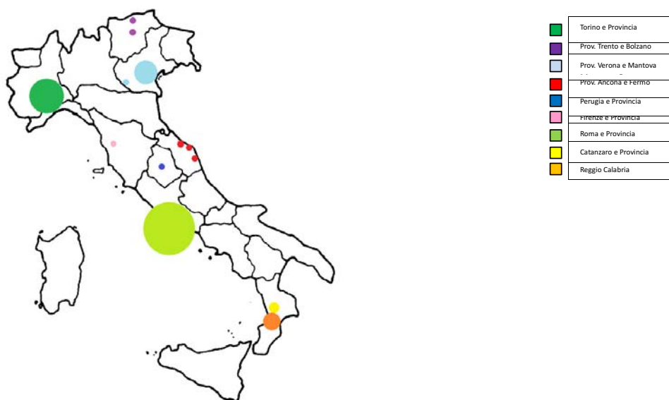
Figura 1.1: Rappresentazione del campione analizzato suddiviso per area geografica (la dimensione del cerchio dipende dalla numerosità dei casi)

Al fine di creare un campione variegato, sebbene troppo esiguo per essere rappresentativo, le organizzazioni incontrate operano in settori diversi dall'agricoltura ai servizi, dalla produzione al commercio, dalla cultura all'edilizia.