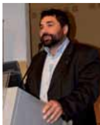
Ugo Biggeri Presidente Banca Etica

Ed infine una nota sull'importanza del luogo scelto per l'assemblea, essa si terrà all'interno della manifestazione Terra Futura, fiera promossa dalla banca e giunta alla sua decima edizione. Una data ed un segno importanti per ricordare che la missione di Banca Etica è, in estrema sintesi, quella di porre l'esercizio del credito al servizio di quanti, attraverso pratiche di vita, di governo, di gestione di impresa si muovono nella direzione di un futuro equo e sostenibile.