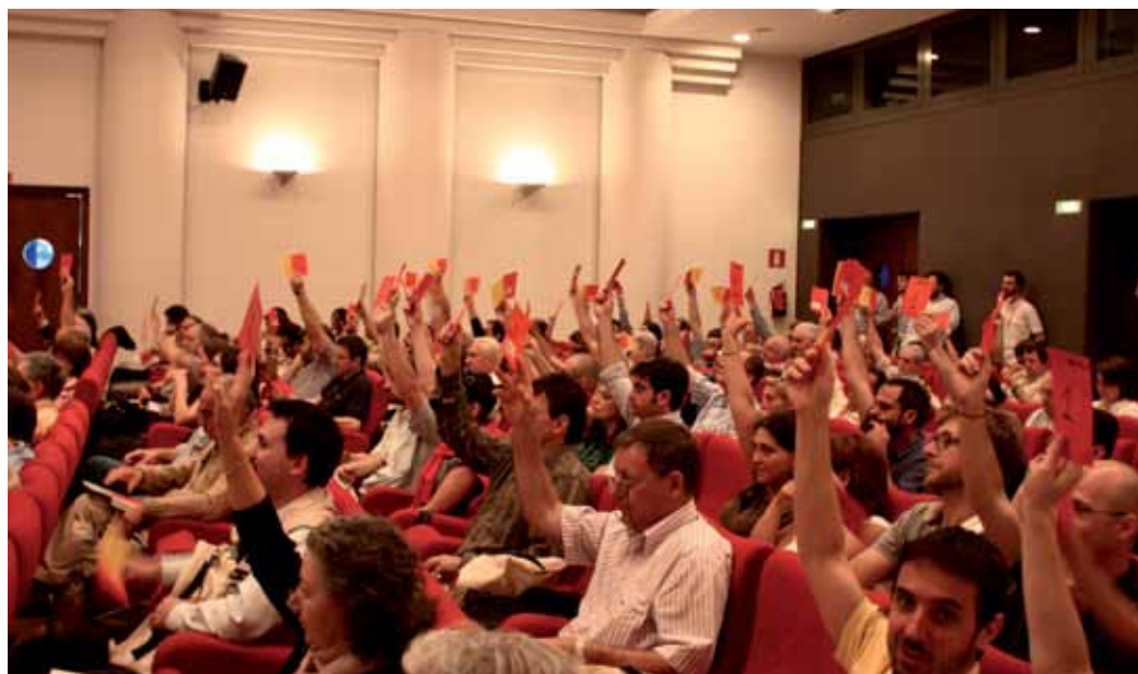
Assemblea di Banca Etica del 2009 - Abano Terme - Un momento delle votazioni

Di seguito riportiamo gli articoli dello Statuto e del Regolamento assembleare (nuova versione approvata durante l'Assemblea dei soci 2012) relativi all'intervento e alla partecipazione in assemblea.